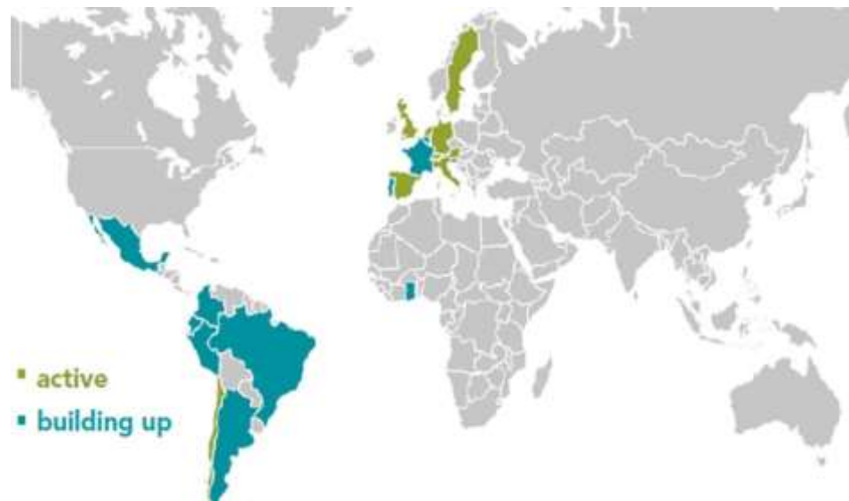
Fig. 1 Presenza di associazioni nazionali dell'EBC

Il dibattito sul modello di Economia del Bene Comune è iniziato nel 2008 come reazione alla crisi finanziaria. Felber ha creato questo approccio teorico e pratico insieme a circa venti imprenditori di ATTAC nel 2010 nel libro "Economia del Bene Comune", che ha coniato il titolo di questo approccio (ultima edizione: Christian Felber, Gemeinwohlökonomie , Piper Verlag 2018). In seguito alla pubblicazione del libro e a un simposio intitolato "Entrepreneurship reconsidered", altre 20 aziende si sono unite al gruppo originario per testare il modello e alla fine è stata costituita un'associazione internazionale. Dal 2010 al 2013, la rete si è sviluppata gradualmente ed è stata creata una struttura organizzativa di governance. La "Economy for the Common Good" non è quindi solo un'idea, ma nel frattempo è sfociata in un ampio movimento internazionale presente in 35 paesi, che coinvolge migliaia di membri e attivisti, centinaia di aziende e decine di Comuni, enti pubblici e organizzazioni che sviluppano e applicano questi concetti nella vita quotidiana delle aziende e delle comunità a diversi livelli.