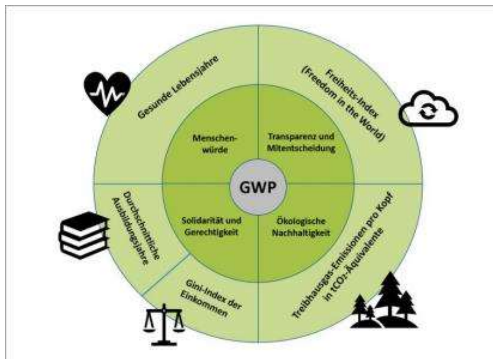
Fig. 5 – Indicatori e dimensioni di un prototipo del prodotto del bene comune

Fonte: Jakob Heyde (2019), Das Gemeinwohlprodukt , Info-Blatt der Hochschule Aalen, 1. Nel cerchio interno figurano i 4 valori fondamentali nell'accezione dell'EBC: dignità umana, trasparenza e co-determinazione, solidarietà e giustizia, sostenibilità ecologica.