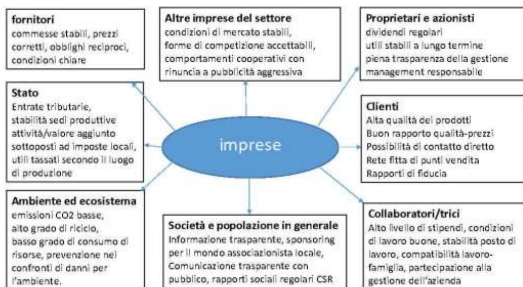
Fig. 8 – Fattori del bene comune specifici per i gruppi di stakeholder

4. I fornitori e i prestatori di servizi non hanno solo diritti nei confronti dell'azienda, ma anche l'interesse a un rapporto commerciale sicuro a lungo termine e a condizioni eque. Un'azienda orientata al bene comune si assume la responsabilità delle condizioni e delle conseguenze che si verificano nell'approvvigionamento di prodotti e servizi lungo tutta la filiera produttiva.