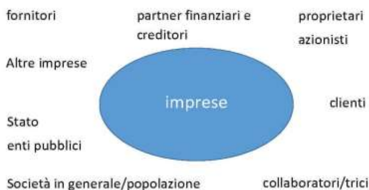
Fig. 7 – I gruppi di contatto di un'impresa (stakeholder in senso ampio)

Quali esigenze nei confronti delle imprese?