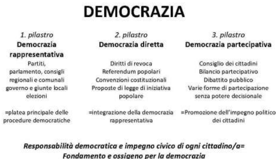
Fig. 9 – I tre pilastri di una democrazia completa

Fonte: Christian Felber, Gemeinwohlökonomie, 2018, 159